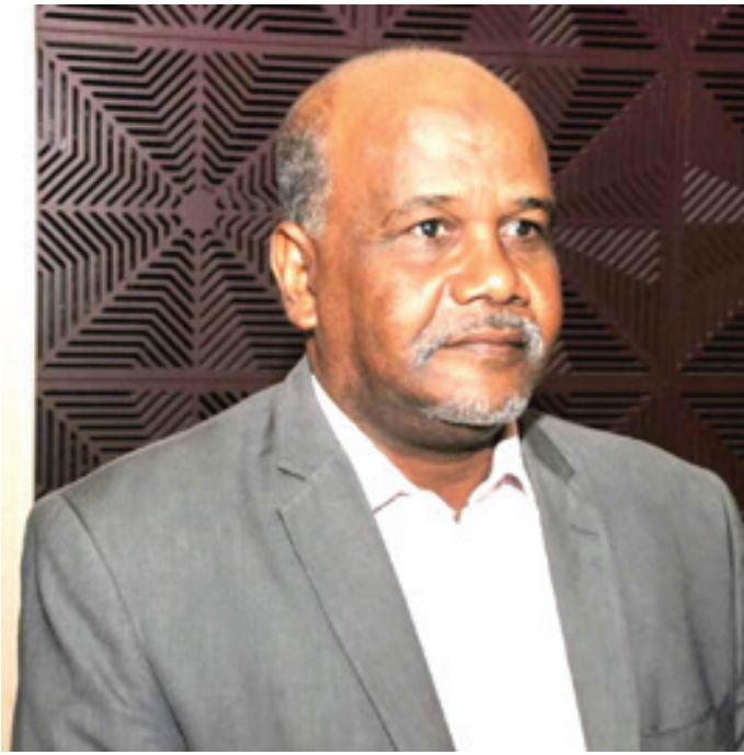
حصد المنات في المعارك الأخيرة في دارفور، والخرطوم وسنار.

ويشير محدثي الي ان الميليشيا تلقت ضربة قاضية بمنطقة الزرق التي كانت بمثابة قاعدة عسكرية ولوجستية مهمة لامداد التمرد بالعتاد والمواد الغذائية والزخائر وكانت حلقة وصل بين مطار ام جرس واقليم دافور وبالتالي مع الهزائم المتتالية والدمار الشامل الذي حاصر التمرد والمصير المرعب لجنودها وهم يواجهون الموت من كل اتجاه جعل معسكرات استنفارها خالية من الشباب.