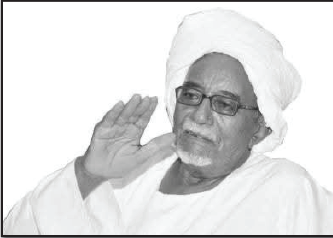
الرمز الرياضي الكبير