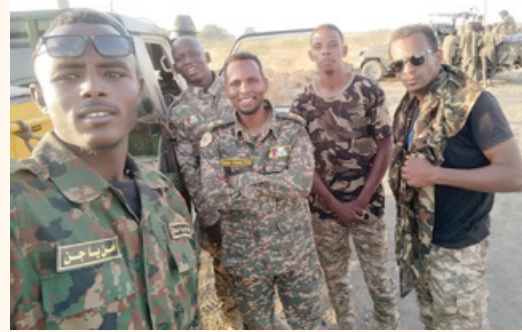
جاهزيتها لخوض معركة الفاصلة مع المرتزقة لاستعادة مدينة ود مدني وكل ولاية الجزيرة.

وهينة العمليات، وبخبرة ودراية تامة بالمنطقة وثبات و يقين النصر الموعود طوقت القوات أم القرى حيث تتركز المليشيا وسط المدينة وكالعادة تتخذ من المنازل والأعيان درع لها، وأضاف «لكن هذه المرة لم تكن كالمعركة السابقة والتي كانت تمهيدا ودرسا للمعركة الكبرى التي تدور الآن فهي أطول وأكبر معركة حتى الآن معركة المنطقة المكشوفة».