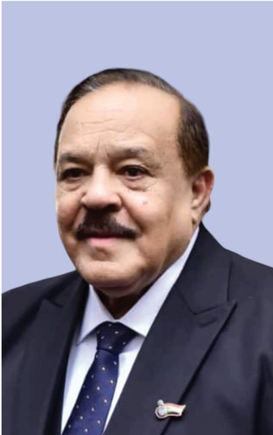
المحفل بعدد من نظرائه وعلى رأسهم الوزير السعودي وآخرين.